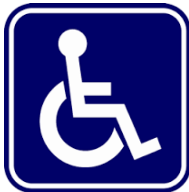
สัญลักษณ์ผู้พิการ